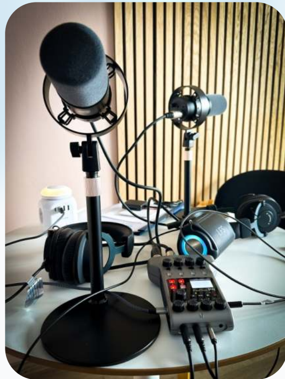
Das foodwatch Podcaststudio.

Mit dem Workshop nehmen wir alle Beteiligten „in `s Boot“. Ganz praktisch auch mit ersten Podcastaufnahmen. Bei Euch vor Ort, oder online.